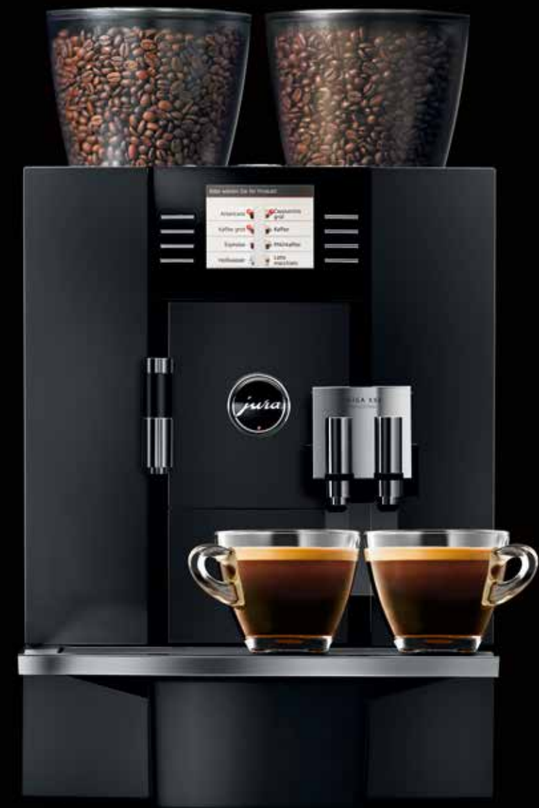
GIGA X8c Professional

GIGA-Kunden kommen in den Genuss eines exklusiven, neuen Servicekonzepts, das dem hohen Qualitätsstandard von JURA vortrefflich gerecht wird. Das »Rundum-Service-Paket« stellt die Leistungsfähigkeit der professionellen Vollautomaten sicher und dient deren Werterhalt, 25 Monate oder 45.000 Zubereitungen lang. Dies beinhaltet z.B. zwei Inspektionen nach 9 und nach 18 Monaten.